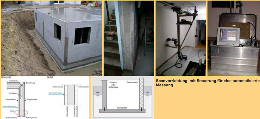
Bau einer weißen Wanne

Mit dem Ultraschall-Echoverfahren lassen sich die verschiedenen Grenzschichten akustisch gut abbilden. Auch flache Grenzschichten werden über die Analyse von geführten Wellen (Plattenwellen) beurteilt. Im vorliegenden Fall erfolgte die Verifikation der Messergebnisse anhand der danach erfolgten Verpressung mit hochviskosen Kunstharzen.