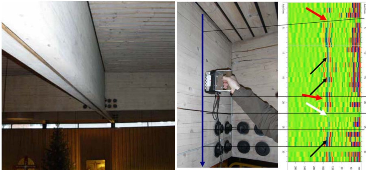
Abbildung 5: Innenansicht der Kirche mit Brett-schichtholz-binder (links); Ansicht Brett-schichtholz-binder mit Riss während Ultraschallechomessung hier in Bereich ohne Nagelplatte, blauer Pfeil markiert Messspur (Mitte); Ergebnis der Messungen entlang Brett-schichtholz-binder, Echos an der Bauteilrückseite (schwarze Pfeile), breiter Riss von Oberflächen (schwarze dünne Linie zeigt Verbindung zwischen Riss in BSH-Binder und Messpunkt im Diagramm ohne Oberflächenwellen und Rückwandecho), Rückwandecho trotz Riss in Oberfläche (roter Pfeil) (rechts)