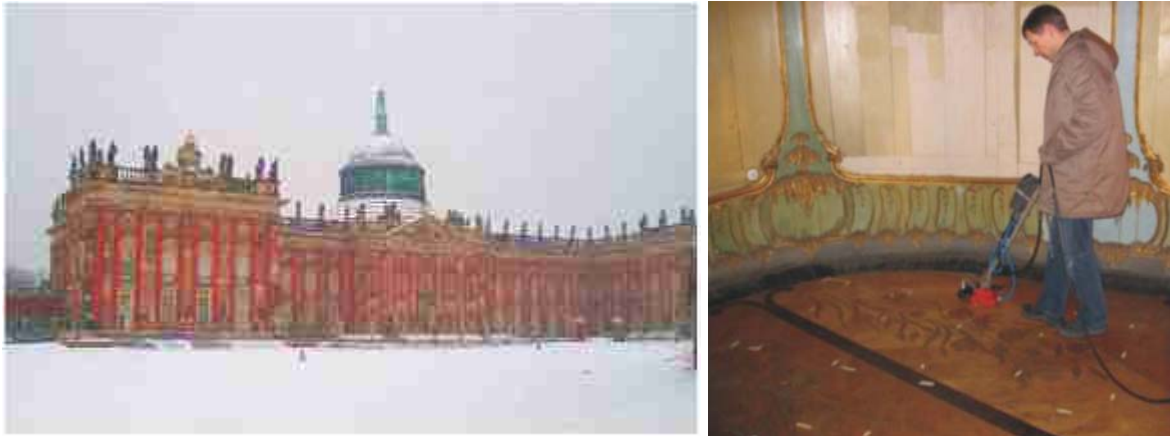
Abbildung 3: Außenansicht des Neuen Palais in Potsdam (links); Messung mit 1,5 GHz Antenne (GSSI) im Tassenkopfbzimmer des Neuen Palais