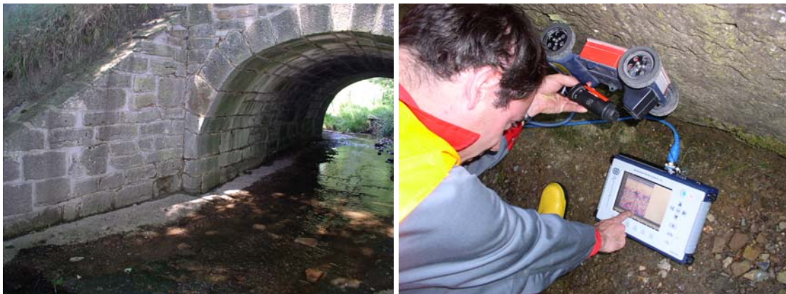
Abbildung 6: Ansicht des Bogens und Auflagerwand mit unbekanntem Aufbau der Böschung und unbekannter Wandstärke (links), Radarmessung (Mittelfrequenz 1,6 GHz, GSSI) (rechts)

An einer Nebenstraße fristete eine Bogenbrücke aus Naturstein ein ruhiges Dasein, bis im Zuge einer Sanierung einer Brücke einer überregionalen Straße der LKW-Verkehr über diese Brücke umgeleitet werden sollte. Um die zulässigen Belastungen zu definieren, musste eine Statik für die Brücke angefertigt werden. Die Angaben für die Berechnungen wurden mit einer visuellen Untersuchung beschafft, aber z. B. die Abmessungen der Steine und Hinterfüllung der Brücke waren unklar und so entschied man sich, mittels zerstörungsfreier Prüfung möglichst viele Daten über das Bauwerk zu erfassen.