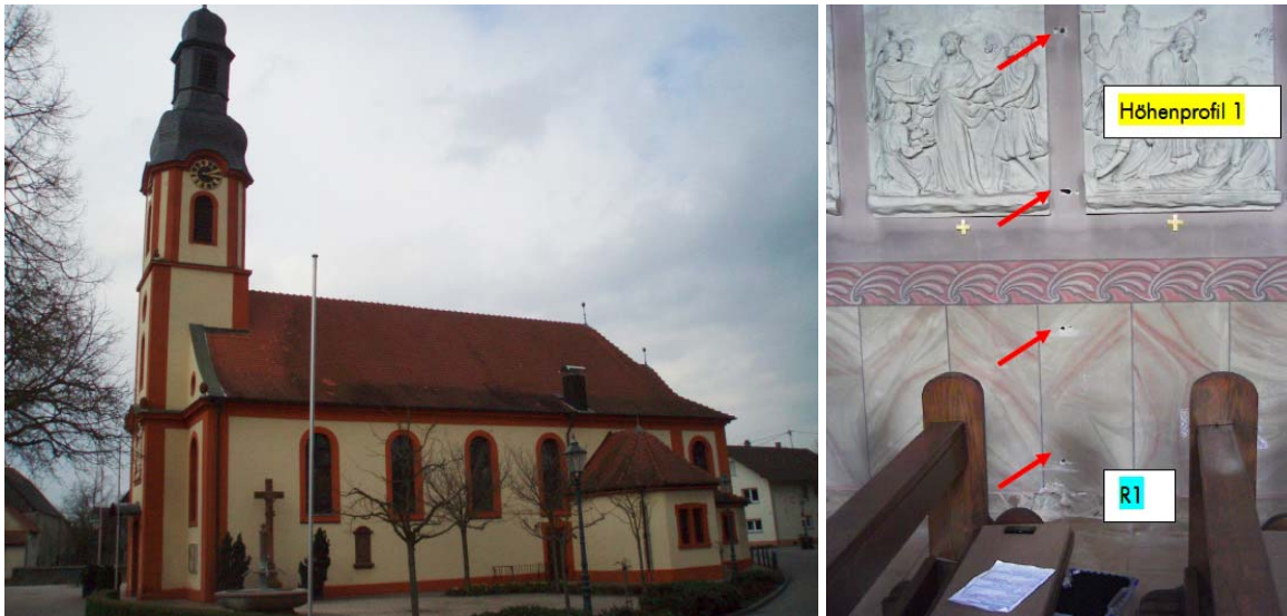
Abbildung 1: Katholische Barockkirche in Süddeutschland, Außenansicht (links); Darstellung eines Höhenprofils zur Salzgehalt- und Feuchtebestimmung (rechts)

Trotz genannter Renovierungen waren an den Innen- und Außenwänden der Kirche Feuchtigkeitsränder bzw. Salzausblühungen sichtbar. Zum Beheben dieser unansehnlichen Schäden war eine dauerhafte Sanierung der Kirche geplant. Mittels Voruntersuchungen sollten möglichst viele Daten über das Bauwerk gesammelt werden, um die Bereiche der erforderlichen Sanierung zu optimieren und so Kosten zu sparen. Für die Planung der Untersuchungen spielte ein künstlerisch wertvoller Kreuzweg aus Gips eine besondere Rolle, da die Befürchtung bestand, dass es bei einer zu hohen Feuchte zu einer Schädigung des Gipses kommen kann. Die Wandstärke betrug ca. 0,8 m (die Untersuchungen ergaben, dass der Wandaufbau wie folgt ist: ca. 20 cm Naturstein, 40 cm Schüttung und 20 cm Naturstein)