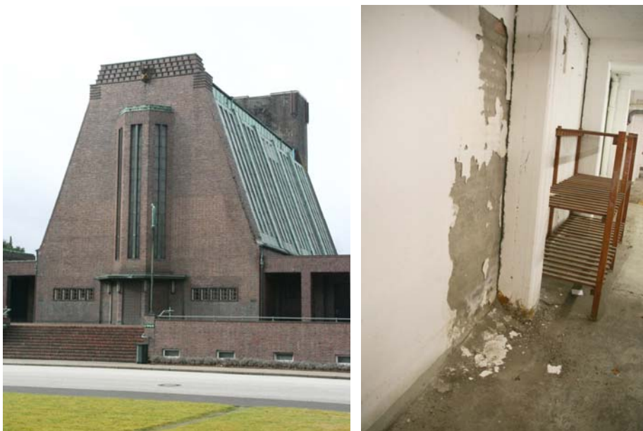
Abbildung 2: Außenansicht des Krematoriums Hamburg-Ohlsdorf (links); Schädigung an tragender Stahlbetonstütze und nichttragender Raumteiwand (rechts): die Schädigung an der nichttragenden Raumteiwand erscheint zwar größer, ist aber von der Wertigkeit her der Schädigung an der tragenden Stahlbetonstütze nachzuordnen.

Bei dem Objekt handelt es sich um eine Stahlbetonkonstruktion in Kombination mit Sichtmauerwerk, dessen Wetterschale aus Hartbranntklinkern besteht. In der Haupthalle bilden im Keller bzw. im Tiefkeller beginnende Stahlbetonspannen, die im Firstbereich aufeinander zulaufen, die Grundkonstruktion. Die Zwischenräume wurden ausgemauert. Die gesamte Außenfassade weist eine Hartbranntklinkerwetterschale auf. Im Dachbereich, der heute eine Kupfereindeckung besitzt, befinden sich zwischen den Stahlbetonspannen Stahlbetonplatten. Darauf befindet sich ein komplexer Abdichtungsaufbau und schließlich eine Hartbranntklinkerschicht. Die Kupfereindeckung erfolgte aufgrund von Undichtigkeiten in der steinsichtigen Dacheindeckung. In den Galeriegängen und Nebenhallen sind Stahlbetonringanker und Stahlbetondecken vorhanden.