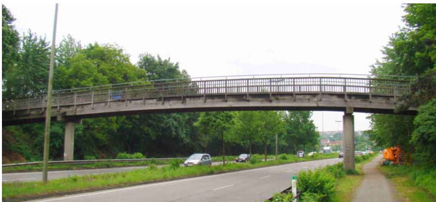
Abbildung 7: Bongossibrücke bei Düsseldorf

Im Folgenden wird die Untersuchung einer Fußgängerbrücke in der Nähe von Düsseldorf, deren Längsträger aus verdübelten Bongossibalken bestehen, mit dem Ultraschallechoverfahren in Kombination mit Bohrwiderstandsuntersuchungen beschrieben. Ungekürzt kann der Text [11] entnommen werden.